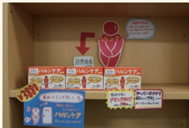
● 1 POP 広告作成例 東京理科大学薬学部 4 年生作成 (p.47 図 1 参照)