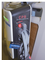
◆ エア抜きコネクターの例